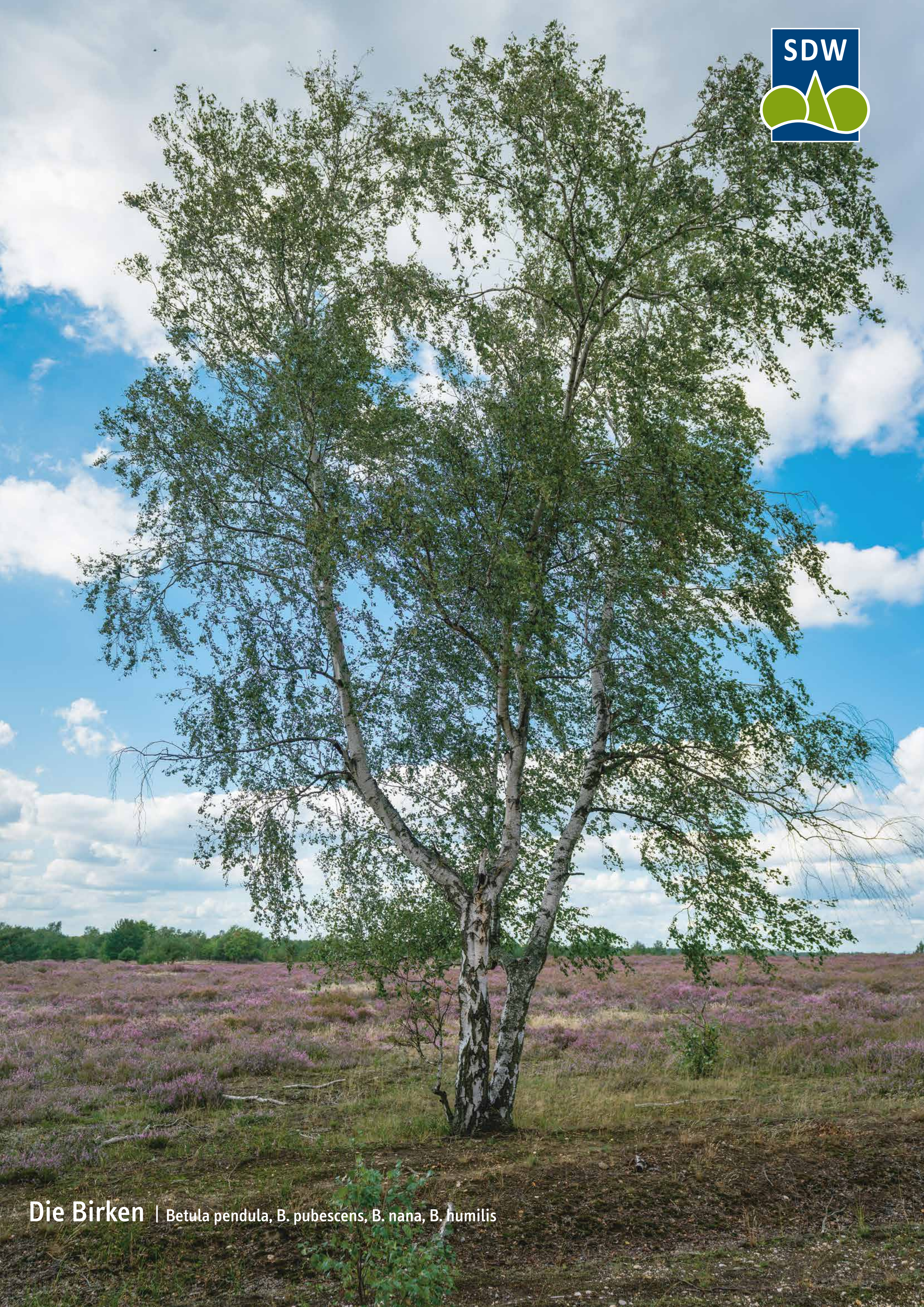
Die Birken | Betula pendula , B. pubescens , B. nana , B. humilis