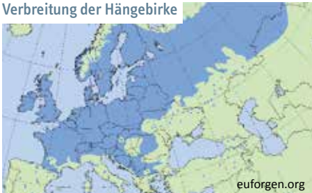
Verbreitung der Hängebirke

Die Birken sind weit verbreitet, vorwiegend aber in den gemäßigten und kühlen Zonen der Nordhalbkugel natürlich vorkommend. Etwa 50 verschiedene Arten gibt es weltweit. Während die Moorbirke bis in 2200 Meter Höhe anzutreffen ist, hat die Hängebirke ihre maximale Höhenlage bei etwa 2000 Metern erreicht, die Strauchbirke bei 1500 Metern und die Zwergbirke bei 800 Metern. Sie alle sind lichthungrig und daher häufig an Waldrändern oder auf Brach- und Kahlflecken, in Mooren und Heiden anzutreffen. Die Moorbirke bevorzugt dabei eher die feuchteren und kühleren Standorte, die Hängebirke wagt sich bis ins südliche Europa vor.