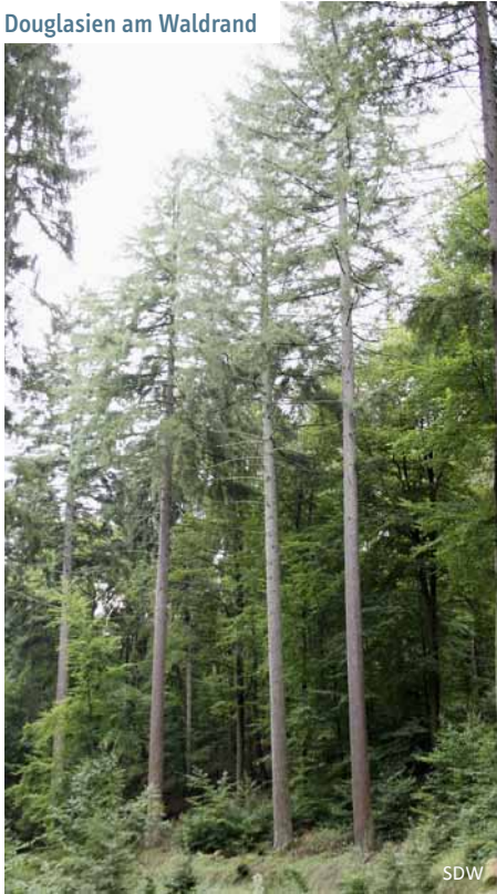
Douglasien am Waldrand

die in jungen Jahren olivgrün aussieht und mit Harzblasen übersät ist, bekommt im Alter einen sehr dunklen rotbraunen bis grauschwarzen Farbton und tiefe Risse. Die zwei bis drei Zentimeter langen, weichen Nadeln sind stumpf und besitzen auf der Unterseite zwei weiße Streifen. Werden sie zerrieben, lässt sich ein aromatischer Geruch wahrnehmen, der an Orangen erinnert. Die Douglasie ist fachlich ausgedrückt „einhäusig getrenntgeschlechtig“, was bedeutet, dass sowohl weibliche als auch männliche Blüten auf einem Baum vorkommen. Sie blüht zwischen April und Mai. Die fünf bis acht Zentimeter langen, eierförmigen Zapfen des Baumes, die zum Boden zeigen, fallen durch ihre weit herausragenden dreispitzigen Deckschuppen auf. Die fünf bis sechs Millimeter langen Flügelsamen, die bis September reifen, fliegen von Oktober bis November durch die Landschaft.