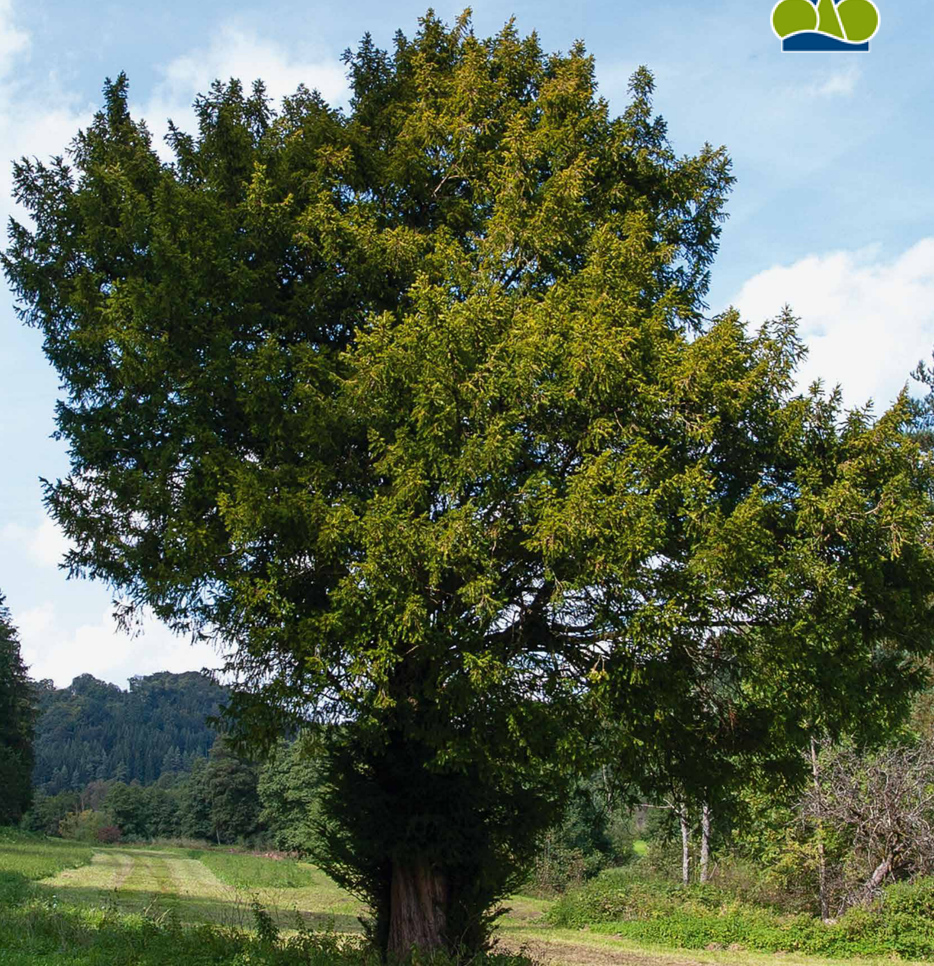
Die Europäische Eibe | Taxus baccata