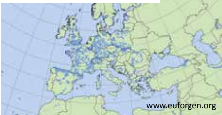
Verbreitung der Europäischen Eibe

Die Europäische Eibe hat ein größeres Verbreitungsgebiet, als ihr Name es vermuten lässt. So kommt sie von Nordafrika bis ins südliche Skandinavien vor, aber ebenso am Schwarzen und am Kaspischen Meer. In nördlicheren Gebieten als Südsandinavien und in Höhen über 1800 Meter über NN findet man sie wegen ihrer geringen Frosthärte nicht. Sie bevorzugt vielmehr milde Winter, kühle Sommer, viel Regen und eine hohe Luftfeuchtigkeit.