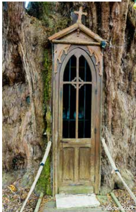
Kapelle im Stamm einer Eibe in Frankreich

war Thüringen mit rund 33.200 Eiben das eibenreichste Bundesland, gefolgt von Bayern (14.700) und Baden-Württemberg (2.500).