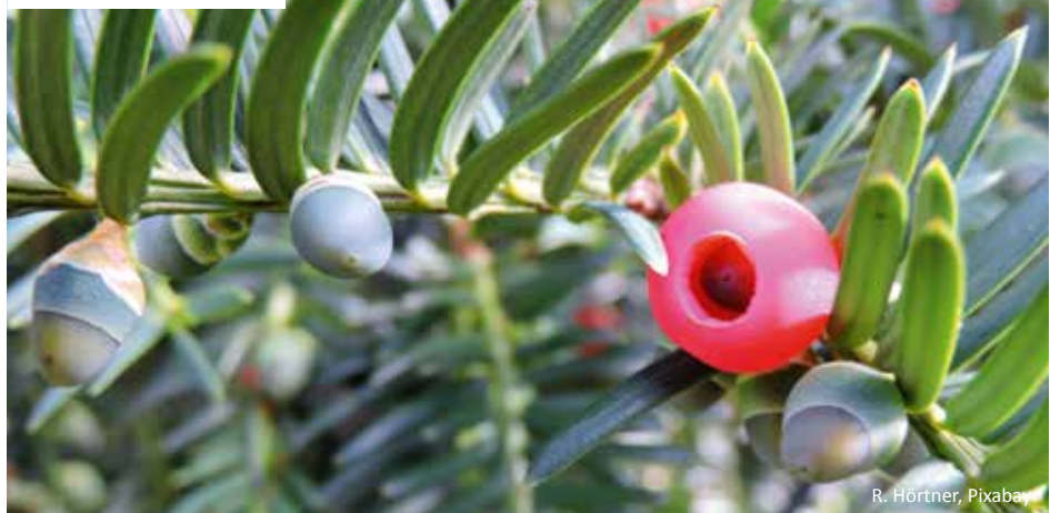
Samen und Samenmantel

Auch außerhalb von Deutschland gibt es interessante Eiben. So wird das Alter einer Eibe im schottischen Dorf Fortingall auf 3.000 bis 5.000 Jahre geschätzt. Sie gilt damit als älteste Kirchhofseibe der Welt. In La Haye-de-Routot in Frankreich befindet sich eine Eibe, in deren hohlem Stamm eine durch eine Tür geschlossene Kapelle eingebaut ist.