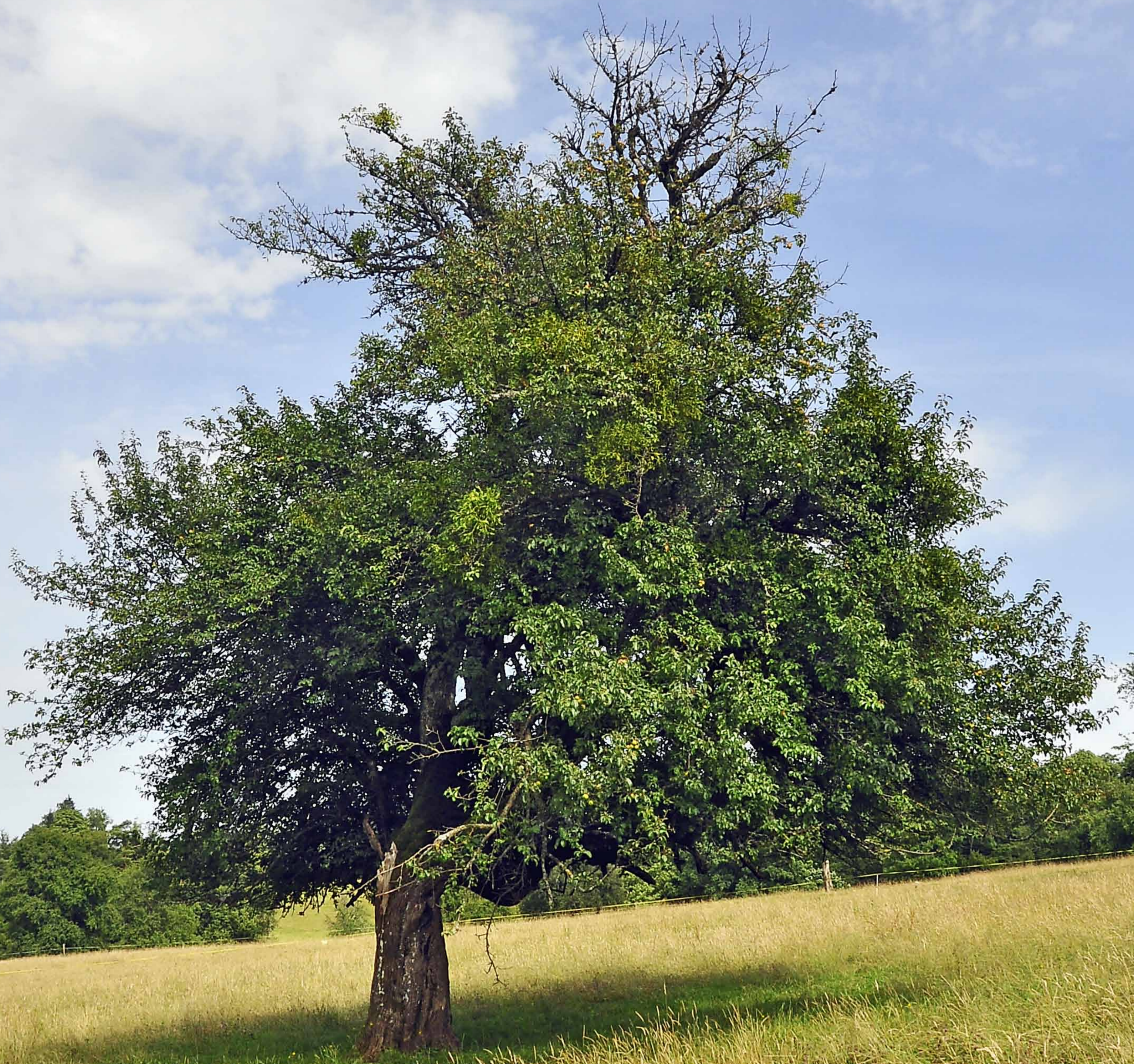
Der Wildapfel | Malus sylvestris