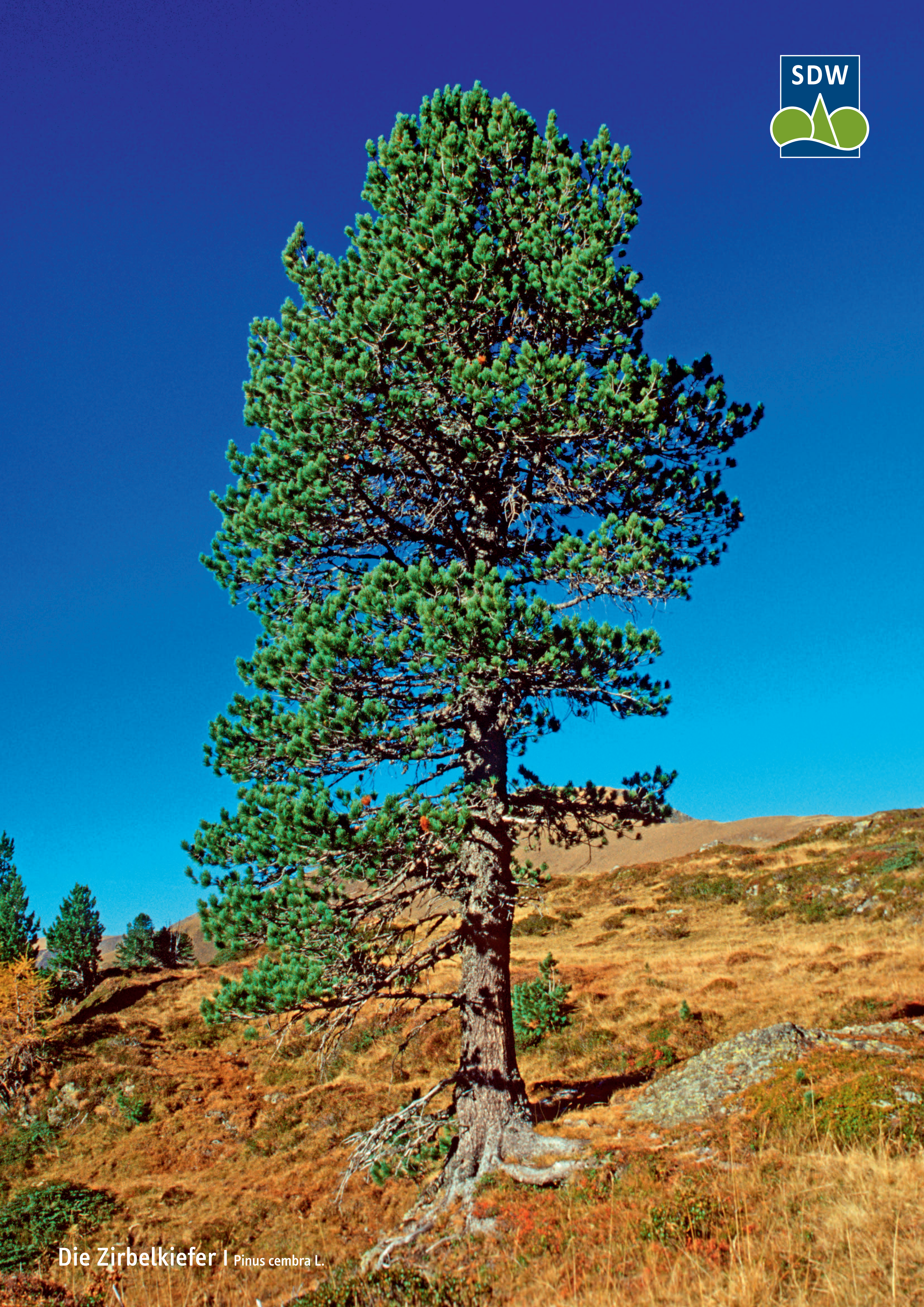
Die Zirbelkiefer | Pinus cembra L.